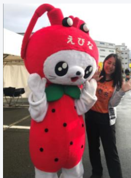
海老名ふれあい農業まつりに参加