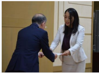
当選証書授与式に出席