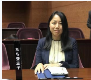
議会では、門沢橋保育園の調理師委託について討論させていただきました