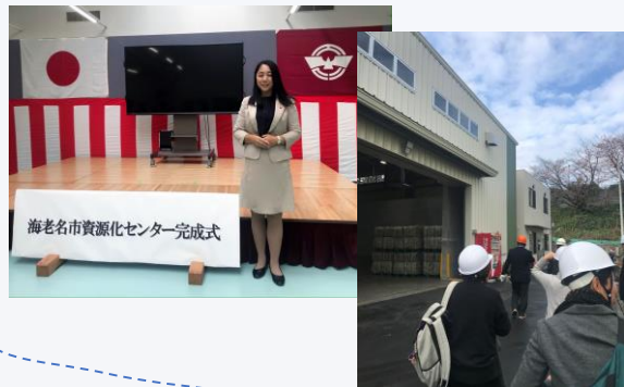
海老名市資源化センターの完成式出席と見学