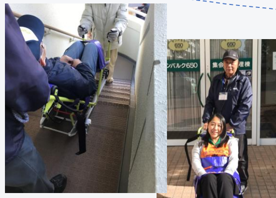
サンパルク650のマンション避難訓練 キャリダンという階段避難車を体験しました