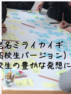
海老名ミライカイギ（高校生バージョン）を傍聴 高校生の豊かな発想に感心！